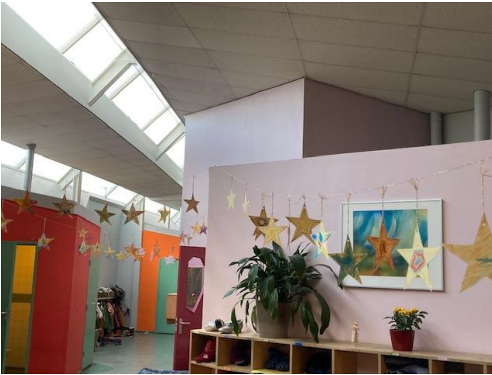
De sterrenslinger gemaakt door de kinderen voor 100 jaar vrije school

Omdat ik zo treurig word van u allen alsmaar te vertellen dat u niet op het plein mag komen of in de school, heb ik de hulp van Sinterklaas ingeroepen. Hij schreef me het volgende: