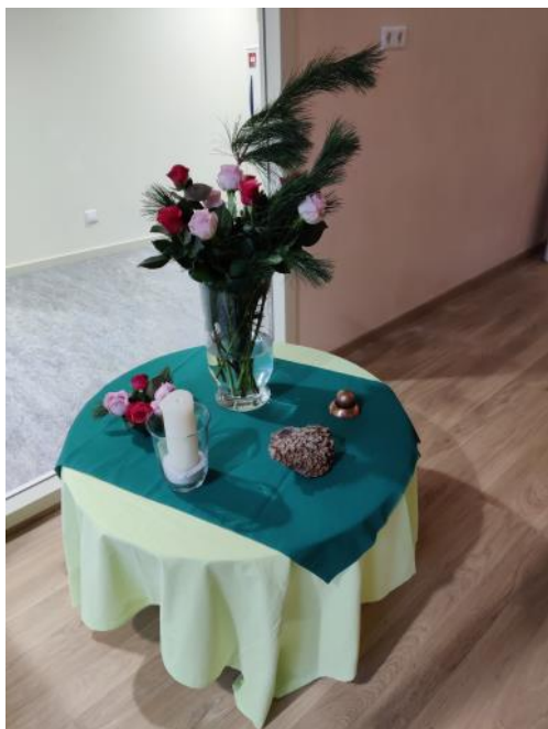
Juf Manja maakt altijd een prachtig tafeltje voor de Euritmiezaal