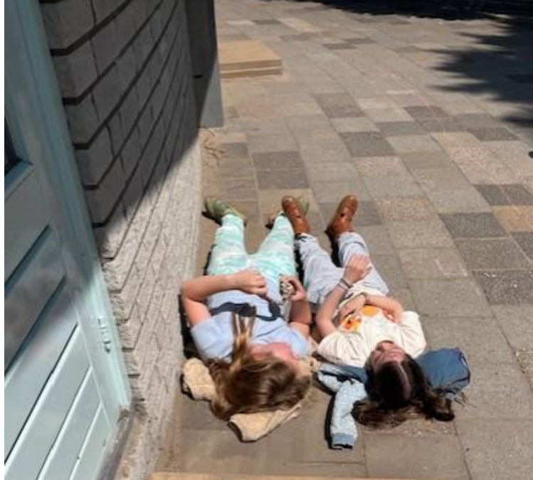
Zomer op het schoolplein!!