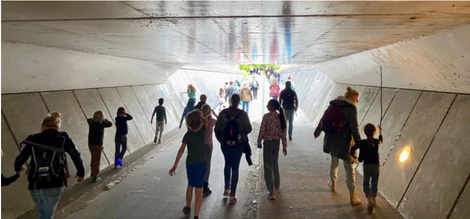
Locatie Engelandlaan en Duitslandlaan