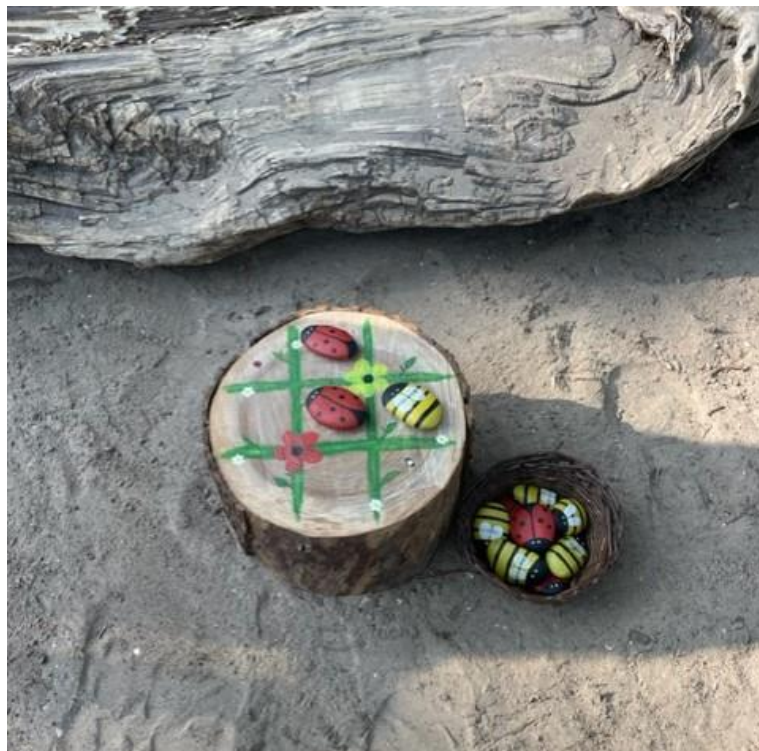
Nieuw! boter, kaas en eieren op het schoolplein