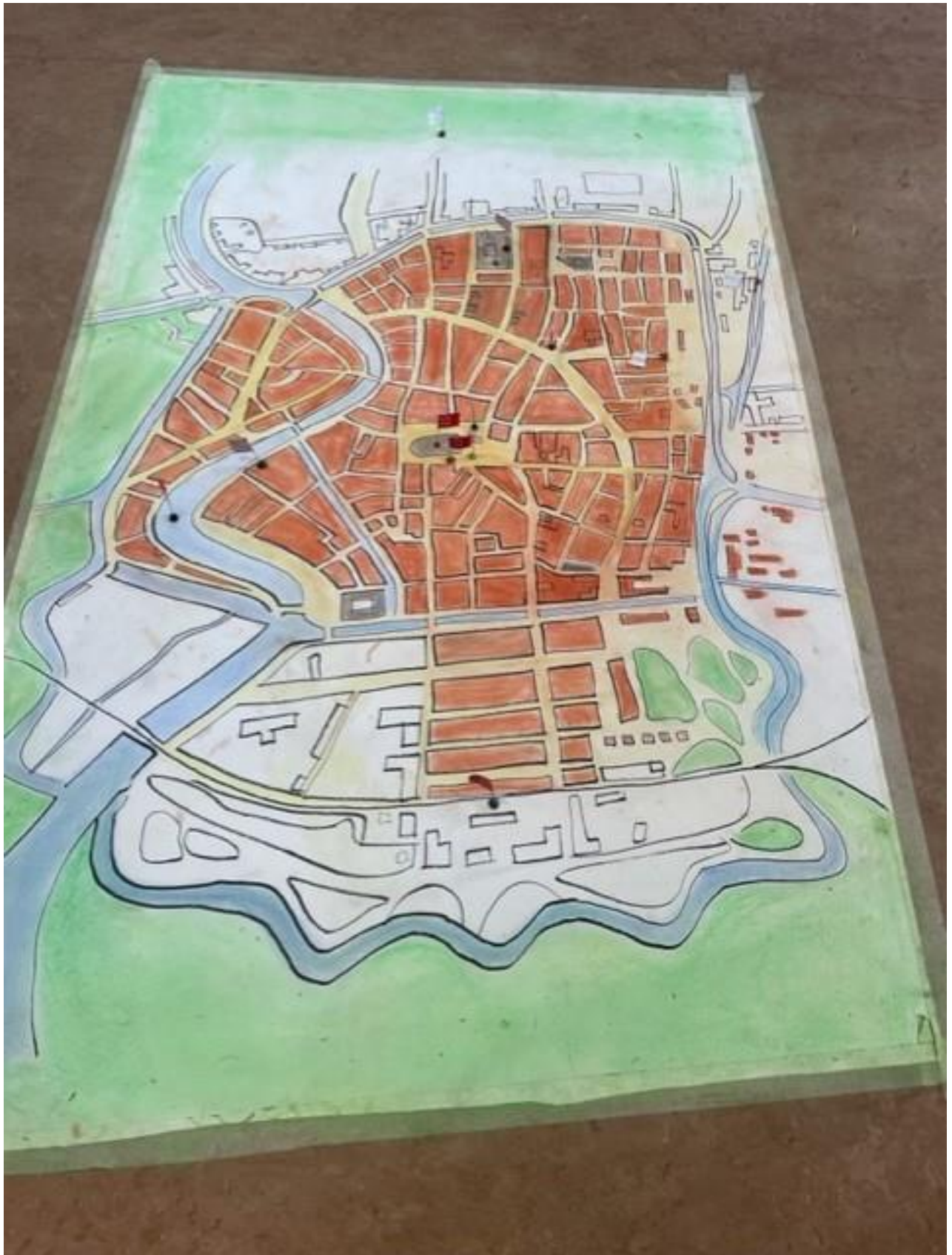
Periode Haarlem, klas 4