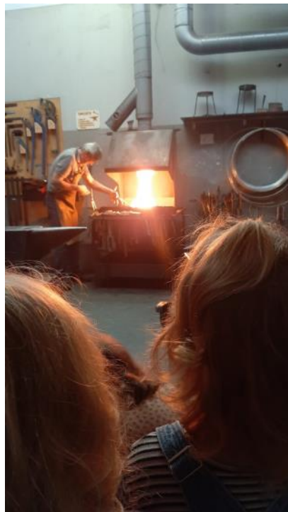
Kleuters bij de smid