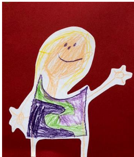
afcheidstekening van Floor uit de kleuterklas van Rosalinde