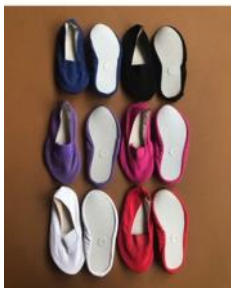
Mykts Euritmie schoentje -roze - Ziloen

De eerste lessen Euritmie zijn achter de rug en de kinderen zijn erg enthousiast. Omdat het voor alle kinderen nieuw is om euritmie te krijgen hebben de meeste kinderen nog geen euritmietjes (speciale schoentjes om op te dansen). Op sokken dansen is te glad, daar glijden de kinderen op uit. Willen jullie voor je kind euritmieschoentjes aanschaffen? Deze schoentjes zijn te koop op o.a. www.ziloen.nl , Voorzie de schoentjes van naam!