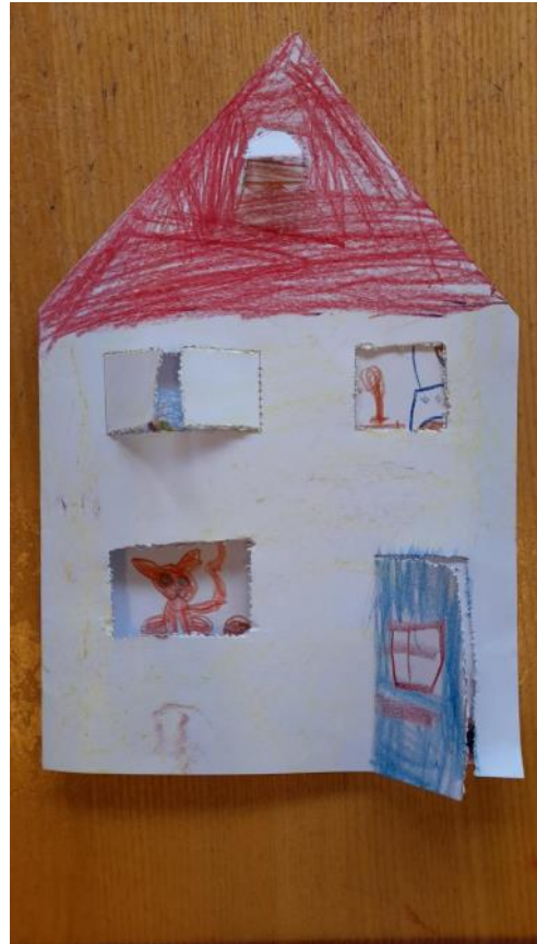
Tekeningen kleuterklas Astrid